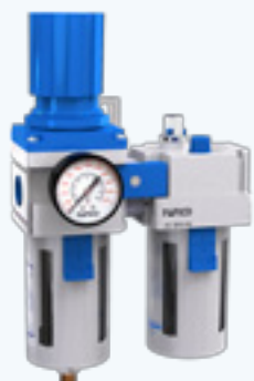
AC 3010-03 ~ 4010-04