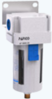
AF 3000-03 ~ 4000-04